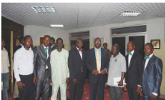
STAN マネジメント・チームのメンバー