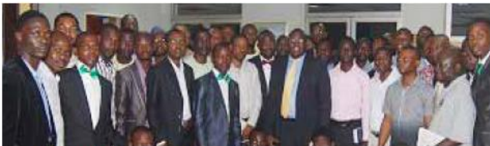
STAN 円卓サミットのゲストの集合写真