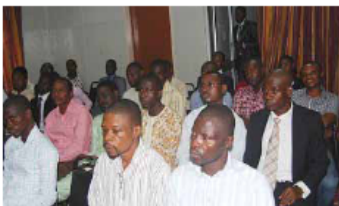
サミットのゲストによるクロス・セッション